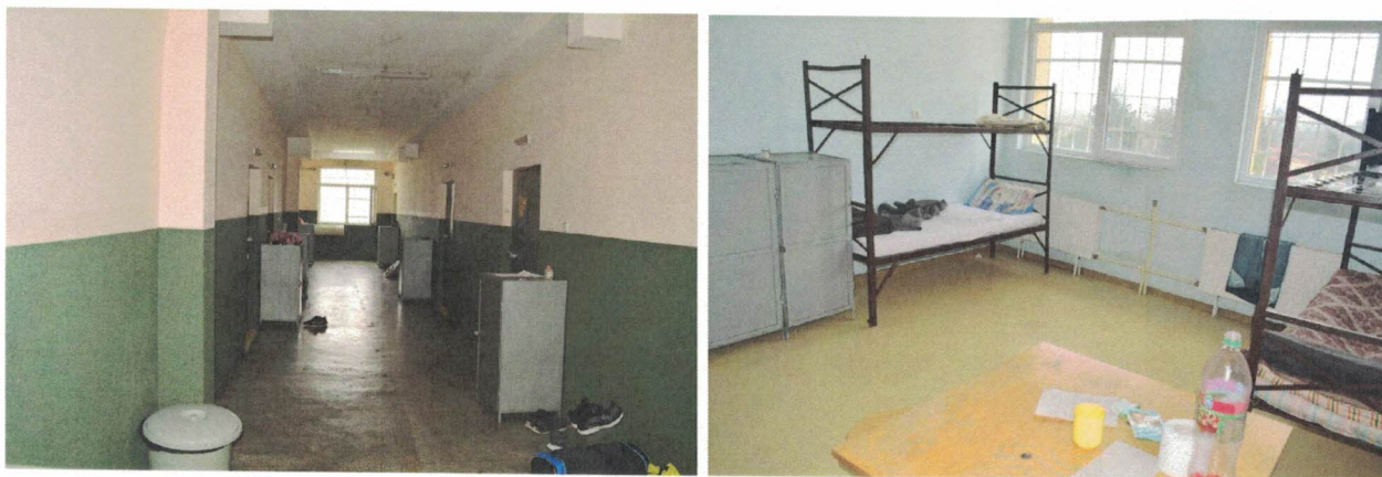
Снимки: Арест – гр. Враца, ноември 2022 г.

В деня на посещението (23.11.2022 г.) бяха задържани 29 лица. Същият ден един задържан е бил преведен в СБАЛЛС към затвора – гр. Ловеч. Капацитетът на ареста е за 60 задържани. Този арест обслужва и област Монтана.