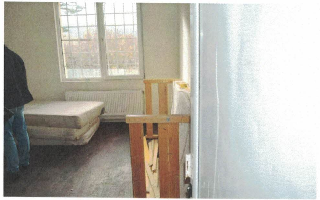
Снимки: Поправителен дом за непълнолетни младежи, ноември 2022 г.

Капацитетът на Поправителния дом е за 32 младежи, по данни на ГД „Изпълнение на наказанията“. От предоставената справка е видно, че към деня на проверката имаше 11 настанени младежи, в това число: