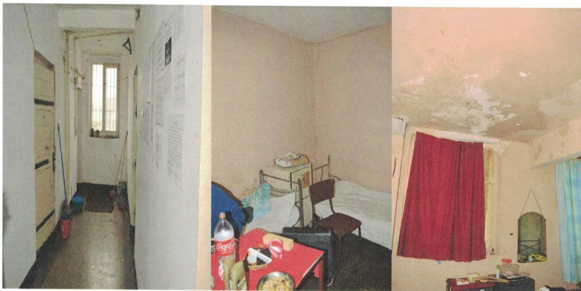
Снимки: Коридор и спално помещение към МЦ, ноември 2022 г.

Кухнята на затвора – гр. Враца се намира в подземието на сградата и също се нуждае от ремонт, като екип на НПМ е констатирал тези лошите условия и през 2021 г. Електроуредите следва да бъдат заменени с нови, поради силна амортизация след многогодишна употреба.