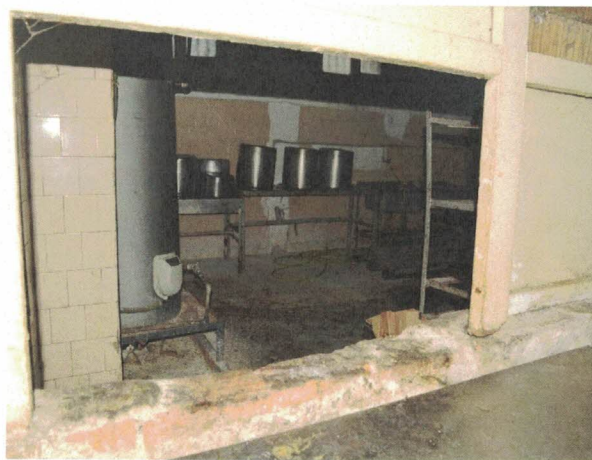
Снимки: кухня на затвора – гр. Варна, ноември 2022 г.

Отново бяха получени множество оплаквания от настанените лица за наличие на хлебарки и дървеници, като наличието на инсекти беше констатирано и от проверяващия екип. Бяха проведени и срещи с лица - лишени от свобода, които имаха белези от ухапвания от дървеници.